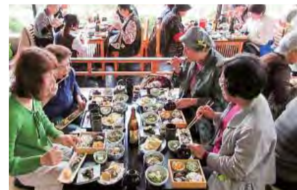
バスハイク八女星野村

健康講座へ職員の参加で楽しく行っています。これからも地域に根ざした活動に頑張ります。