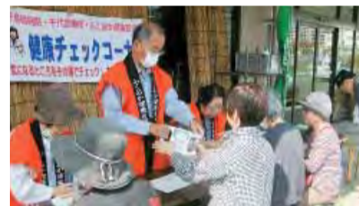
さいさい前でまちかど健康チェック

楽しいことはもちろん、帯封・手配り何でもござれ「箱崎なでしこ班」はいま20名近くの班員がいます。いつでもどこでもたくさん集まってくれる、頼りがいがあるみなさんが自慢です。また、支部の運営委員も若返り?を図り、力持ちさんが増えました。みんなで健康づくりをすすめています。