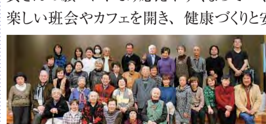
古湯温泉へバスハイク

今年は西支部にとって、城南支部を立ち上げる年です。小さな支部は心細い?そんな事はないのでは?一つの区に一つの支部になれば会員さんの願いに、より応えやすくなっていく気がします。楽しい班会やカフェを開き、健康づくりと安心の輪づくりを進めていきたいですね。