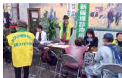
百緑市でのあぞら健康チェック

にとりくんでいます。また、新しく太極拳班をたちあげました。いま、道路や踏切の段差などのまちなみチェックをして、改善が必要な所を市役所に求めています。