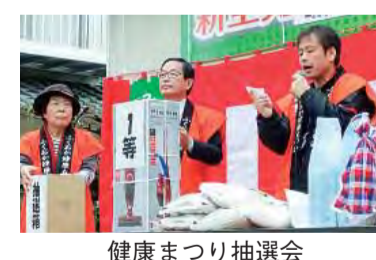
健康まつり抽選会