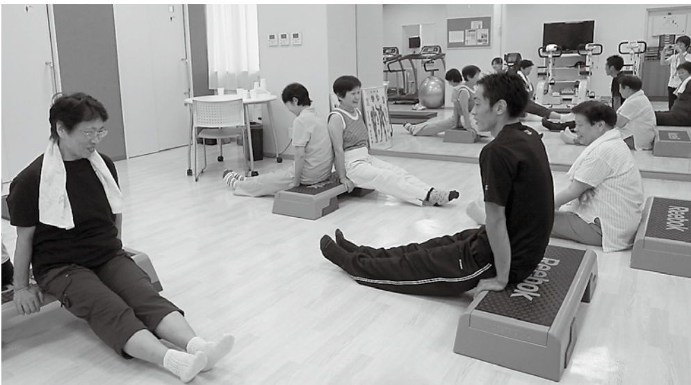
これから二の腕のトレーニングです