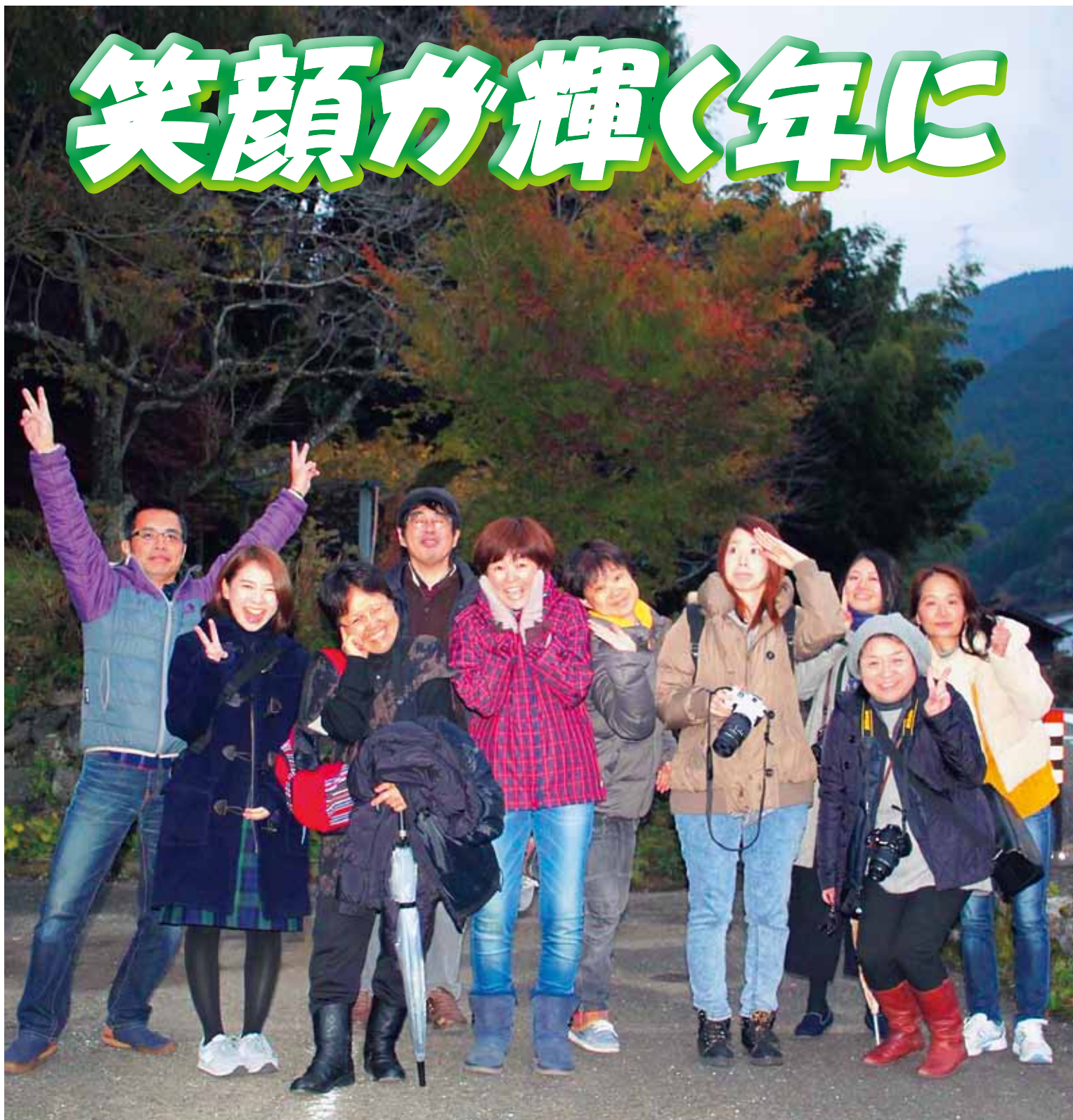
いつも明るい「ちどり写真クラブ」のみなさんです。「秋月に撮影会に来ました」