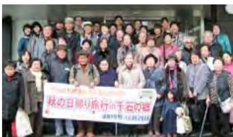
日帰り旅行 in 千石の郷

楽しいことはもちろん、帯封・手配り何でもござれ「箱崎なでしこ班」はいま20名近くの班員がいます。いつでもどこでもたくさん集まってくれる、頼りがいがあるみなさんが自慢です。また、支部の運営委員も若返り?を図り、力持ちさんが増えました。みんなで健康づくりをすすめています。