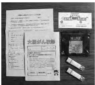
問診票と採便容器 クーポンは窓口にあります

あわせて、1月から3月までは大腸がん検診キャンペーンにも取り組んでいます。友の会クーポンを利用すると、無料で受けられますので、この機会にぜひお受け下さい。