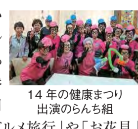
14年の健康まつり出演のらんち組

支部の自慢は、毎月行っている「らんち&カラオケ」です。アルコール抜きでしっかり唄い、踊っています。大楠診療所が立て替えのため、近所の公民館を利用しています。昨年は「焼き牡蠣グルメ旅行」や「お花見」などの行事を企画して、支部全体に参加を広げました。