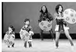
西支部・花笠音頭 (前年の舞台より)