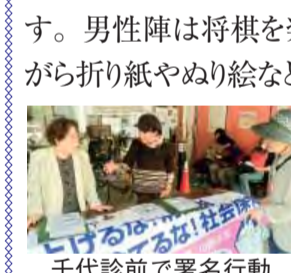
千代診前で署名行動