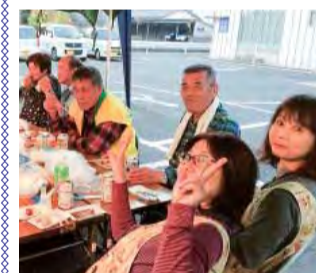
まつりの後のうちあげ交流会

私たちの支部は、年間行事(バスハイク・健康まつり・もちつき)の他、商店街の百緑市での健康チェックや悪政ゆるさんばい活動