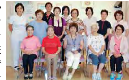
フィットネス班です

女性が元気なわかすぎ支部です。活動がさかんなカラオケ班とフィットネス班は女性の班長さんです。また、年末には正月料理を作る会を