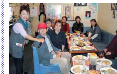
楽しいカラオケ班会

料理上手な運営委員さん中心に開催しました。それぞれの特技を生かして自主的に活動を行なっています。