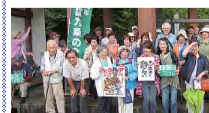
雨の油山観音集会