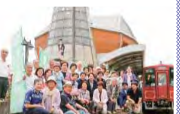
鉄道ハイクをしました