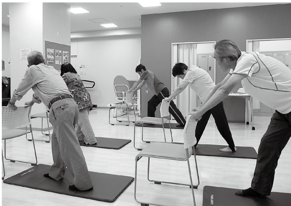
アキレス腱とふくらはぎ伸ばし

新年あけましておめでとございます。寒い時季がまだまだ続いています。かがお過ごしですか？寒いと感じたときは暖房を入れて電気を消費する前に、身体を大きく動かして活動エネルギーを消費して身体を温めてみましょう！カロリーを消費できて電気代も安くなる、一石二鳥の効果がありますよ。