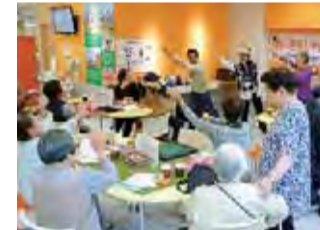
楽しい「きんしゃいカフェ」

昨年は念願だった憩いの場「きんしゃいカフェ」をオープンすることができました。毎月第1・第3木曜日の14時から16時、コーヒーとお菓子を用意し、HPH情報センターで開催しており、毎回20名を超える方々が集まっています。男性陣は将棋を楽しみ、女性陣はおしゃべりをしながら折り紙やぬり絵などの他、みんなで歌や踊りを楽しんでいます。