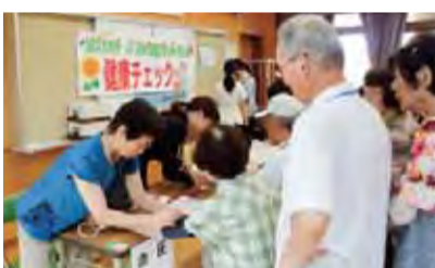
健康チェックに長蛇の列

支部の自慢は、班会が多彩に開催されている事です。また、友の会全体でとくみをしている高齢者の居場所づくり「ほちぼち亭」の活動が、支部活動を元気づけてくれています。診療所との連携も良く、「地域を元気に!!」を合言葉と一緒に取り組んでいきます。