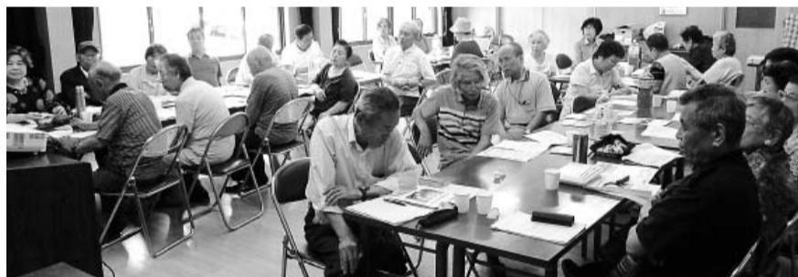
支部の活動を聞く参加者

西支部は、城南区、早良区、西区の3行政区と糸島市を網羅し、世帯数は4,000世帯を超えています。大きな支部となったため、2年前の友の会総会で西支部分割の提起がされました。しかし、当時支部長をしていた私も含めて役員のほとんどが支部分割には消極的、いやむしろ反対でした。理由は、「役員になり手が少なく、分割していたらやっていけない」というものでした。