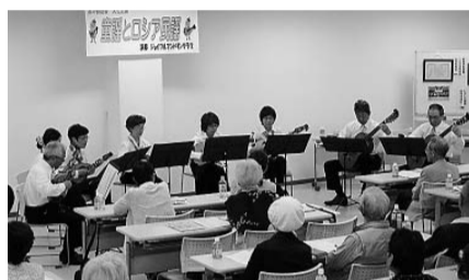
ジョイフルマンドリンクラブによる演奏

ふくおか健康友の会は、5月28日(土)ちどりビル会議室にて、「第18回定期総会」を開催しました。出席者は138名、午後13時～15時30分の討論に入ります。