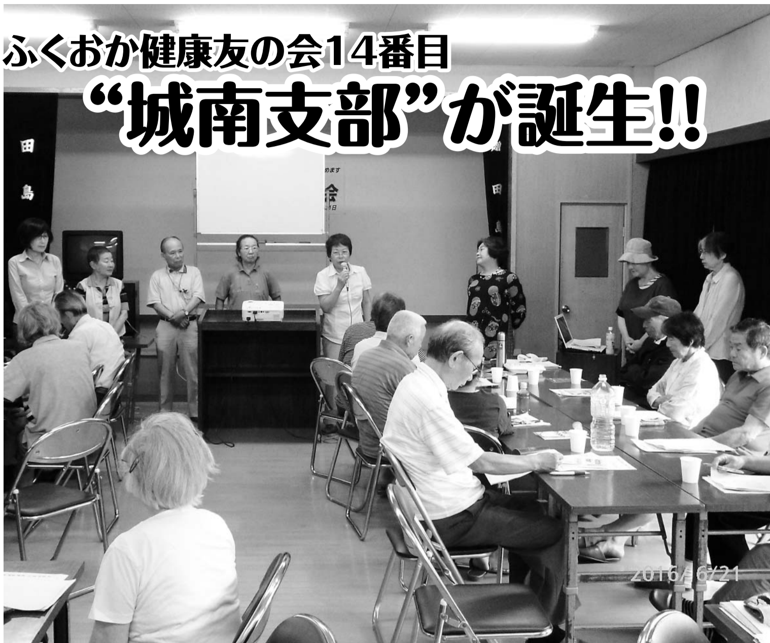
支部役員の紹介をする大賀支部長(写真中央)