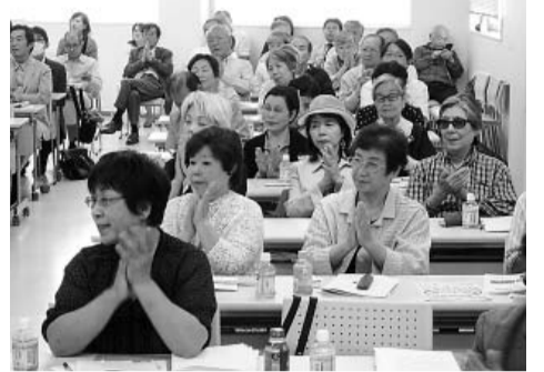
拍手を送る参加者のみなさん

ふくおか健康友の会は、5月28日(土)ちどりビル会議室にて、「第18回定期総会」を開催しました。出席者は138名、午後13時～15時30分の討論に入ります。