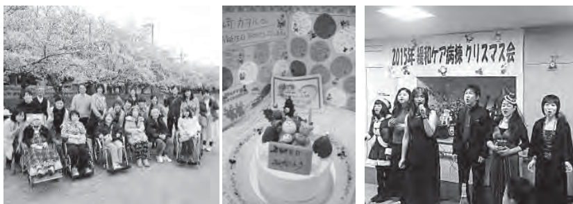
お誕生日祝いや季節に応じた行事を行っています

がんは日本人の死因で最も多い病気で、3人に1人ががんで亡くなっています。がん患者さんは、がん自体の症状のほかに、痛み、倦怠感などのさまざまな身体的症状のほかに、悲しみ不安など精神的な苦痛を経験します。「緩和ケア」は、がんと診断された時から、身体的、精神的な苦痛を和らげるために必要なケアとされています。といっても「緩和ケア病棟」というと、最期の場所というイメージをお持ちの方も多いと