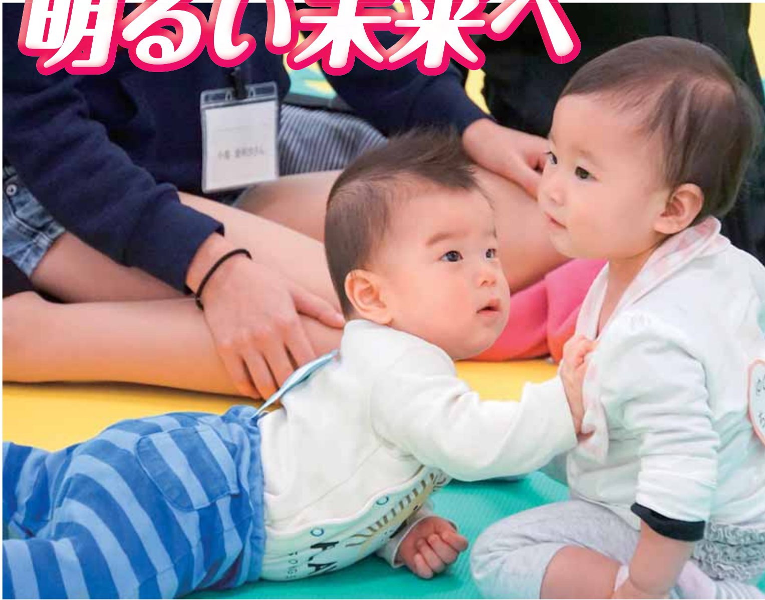
(赤ちゃん同窓会より)