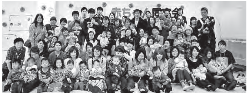
赤ちゃん同窓会に集まった参加者のみなさん

赤ちゃん同窓会は千鳥橋病院で生まれた生後6ヶ月〜1歳前後のお子様とご家族の方を対象に同窓会をしようとして1987年より始まりました。