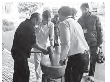
熱いうちにもち米をこねます

が交互に餅をつきました。途中、患者さんや親子連れが飛び入り参加するなど楽しく餅つきを行いました。40kgのもちも3時間弱でつき終えることができました。ついた餅は、友の会