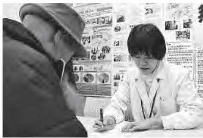
直接相談も多数受け付けました

12月14日(水)に千鳥橋病院で「第5回無料低額診療相談会」を行いました。直接面談と電話を通して、30代から90代まで幅広い年齢層から25件の相談が寄せられました。「2人の子どもと3人暮らし。月5万の年金と子どもの低い収入で生活