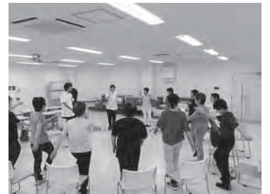
↑ウォーキングコースの様子