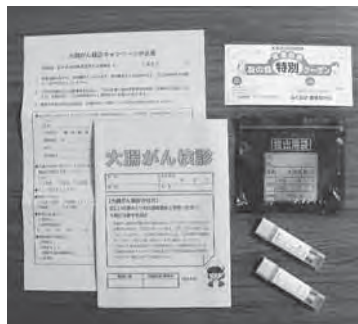
問診票と採便容器 クーポンは窓口にあります

あわせて、大腸がん検診キャンペーンに取り組みます。友の会クーポンを利用すると“無料”で受けられますので、この機会にぜひお受け下さい。なお、インフルエンザ予防接種キャンペーンは1月末まで実施中です(ただし、在庫がなくなり次第終了となります)。前立腺がん検診キャンペーンも2月に、胃がんリスク検診(ABC検診)や女性がん検診はいつでも受けられますので、ぜひご利用下さい。