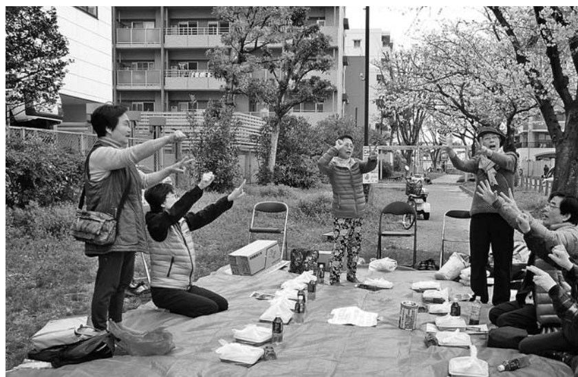
みんなで脳トレ体操