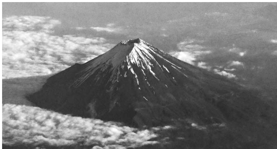
「雲海と名峰富士」 たちばな支部 旅野 途中