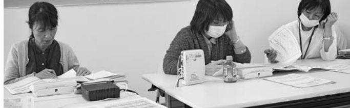
前回の相談会より

医療費のことで困っていませんか? お気軽にご相談下さい ～第6回無料低額診療相談会を開催します～