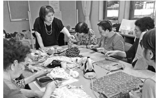
▲わかすぎ支部の「わかすぎサロン」

「わかすぎサロン」 女性中心で、おし ゃべりしながらパツ チワークなどを楽 んでいます。 【田川支部】 「介護カフェ」 介護の相談を受け ながら、手料理でお もてなしがされてい ます。