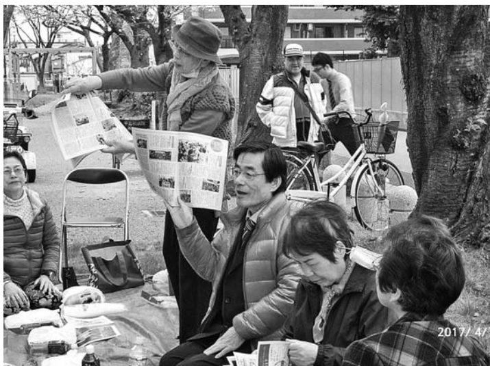
いつでも元氣、を大いにPR