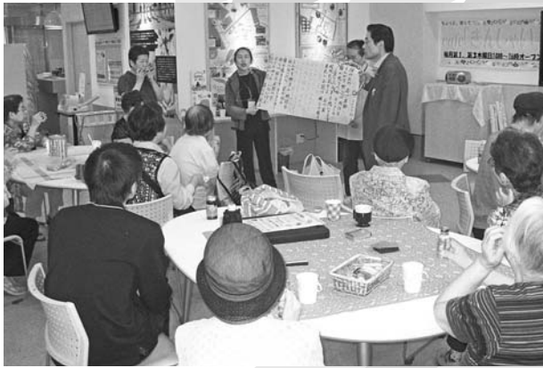
▲きんしゃいカフェ

2017 5 vol.68 福岡医療団 発行責任者 舟越光彦 福岡市博多区千代5-18-1 TEL 092-651-1522