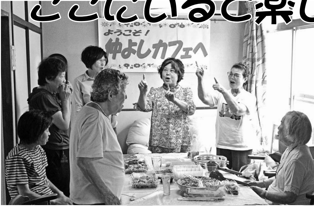
▲城南支部の「仲よしカフェ」