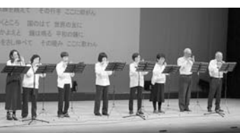
風の会 (たちばな支部)