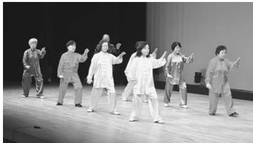
日中友好太極拳サークル (西支部)