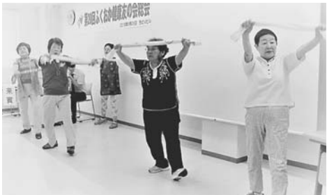
みんなで脳トレをしました（昨年写真より）