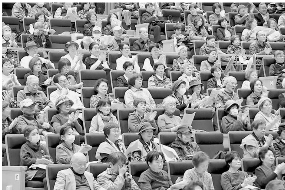
満員の会場から大きな拍手