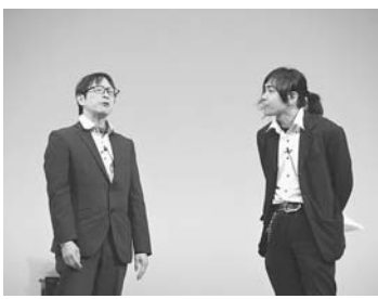
センター事業団 (博多支部)