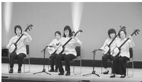
オープニング 津軽三味線

今年で13回目を迎えた「すこやか春の文化祭」が、3月10日（日）サンレイクかすやで開催されました。「温もりの手で守ろう・平和と文化、安心のくらし」をテーマに、友の会と職員から24演目の舞台が披露され、フロアでは160点を超える出展がありました。さらに、恒例となった「風船パフォーマンス」も会場を盛り上げるなど、750名が集い、終始熱気に包まれました。