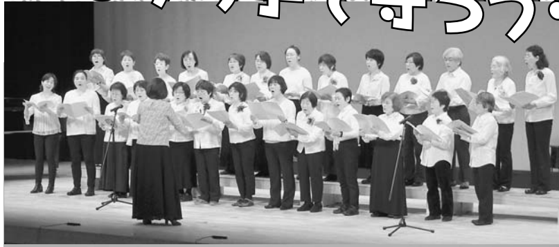
歌おう会班（東区西支部）合唱