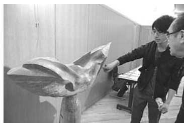
彫刻『波打つ』(西支部)