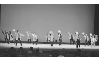
舞踊体操 (城南支部)