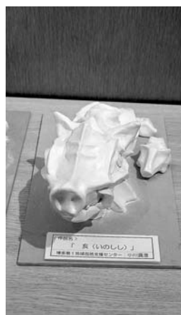
オブジェ『亥(いのしし)』(博多第1地域包括支援センター)