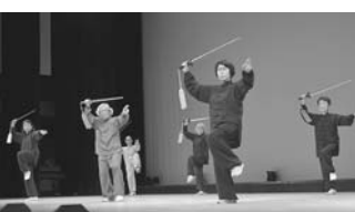
太極拳サークル (博多支部)