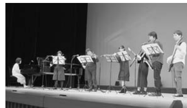
千鳥橋アンサンブル (職員)