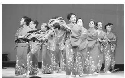
藤間流 錦鈴会 (たたら香椎支部)