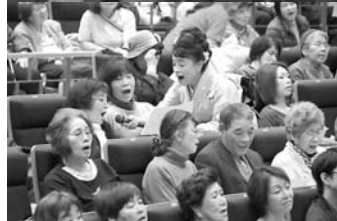
合唱 (わかすぎ支部&須恵診療所)