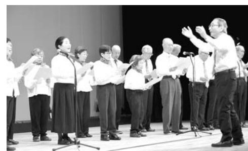
ランチみんなで歌う会 (南支部)