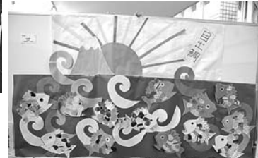
貼り絵『目出鯛』(南支部)