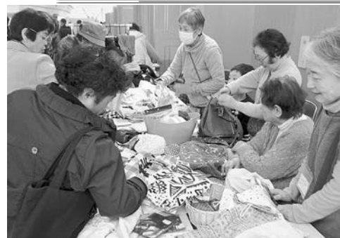
『手作り小物』(かすや支部)