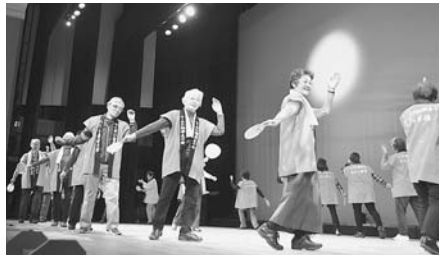
盆踊 (たたら香椎支部)