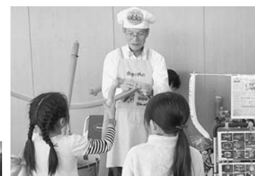
大人気!風船パフォーマンス