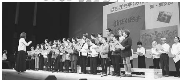
ぼちぼち亭とオール東の東支部 (東区東支部)