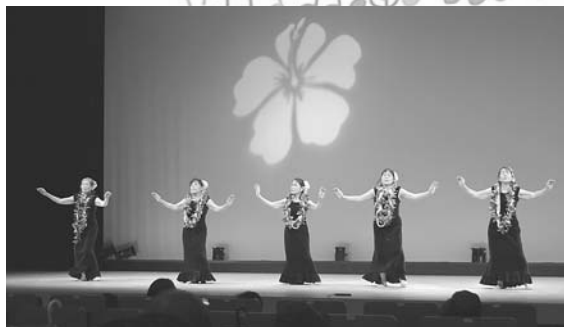
イリマ・フラサークル (かすや支部)