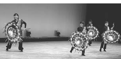
銭太鼓サークルこんべいとう (東区東支部)