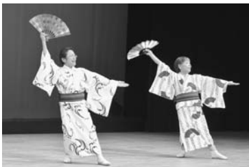
さんしゃいカフェ (博多支部)