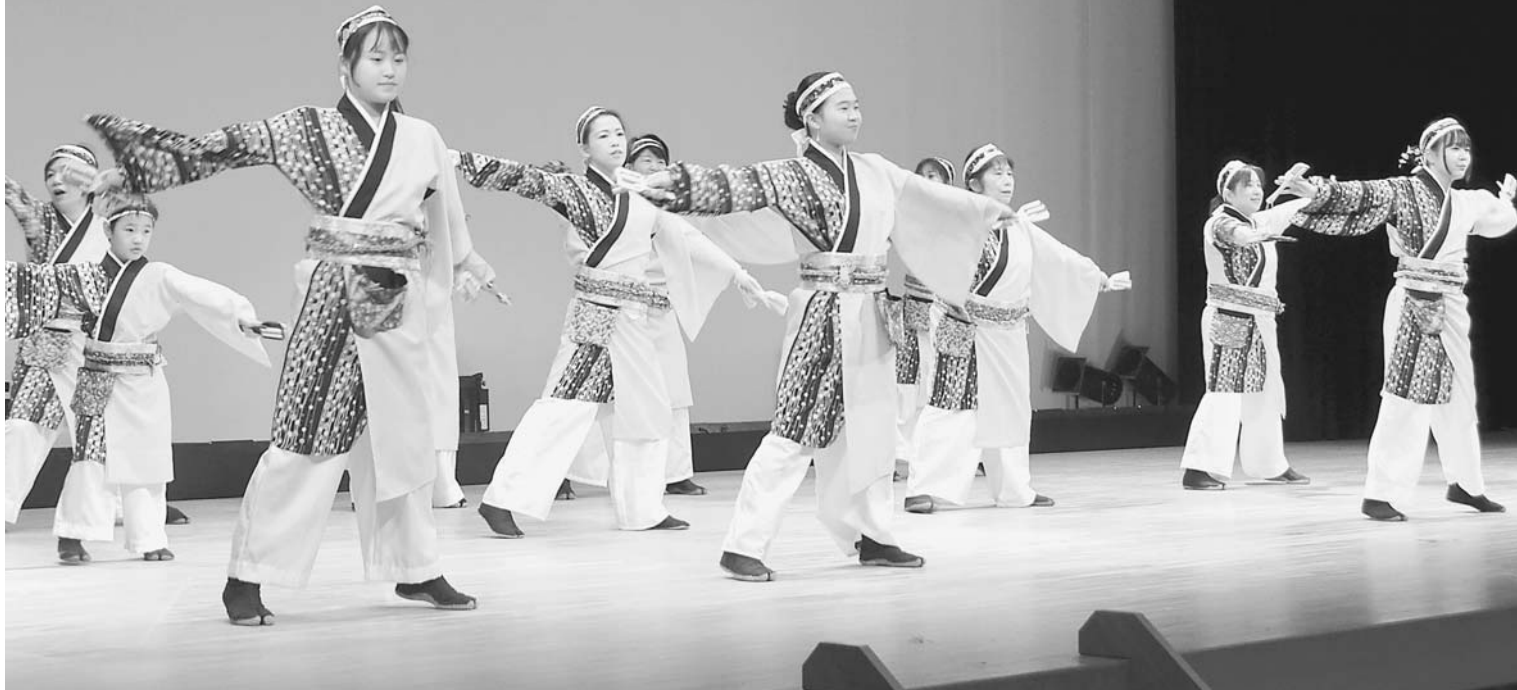
「よさこい」若翔連（かすや支部）