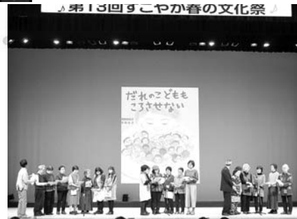
9条を守る班 (中央支部)