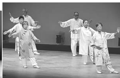
香陵公民館太極拳サークル(東区東支部)