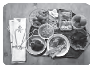
肉類、柔らかいものを避けた食事

本自前」と歯を見せてにっこり。また、14歳のときから毎日何をやって何を食べたか欠かさず日誌にしており、過去のものも全て保管しています。歯だけでなく、視力も両目20をキープされています。そして布団の上げ下ろしなど道具に頼らず体を動かすことが大事だと話します。「便利なものは使いません。健康は自分でつくることを心がけています」と力強く話します。