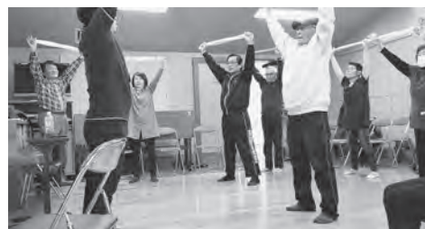
元氣よくタオル体操

ご家族や親しい友人、区役所、近くの交番、消費者センターなど、信頼できる人にまず相談することが大切です。詐欺師は「〇〇までに手続きをしなければ…」とか、「今すぐ〇〇しなければ…」などと言葉巧みに脅して、不安な気持ちにつけこみます。実際には、急いで手続きしなければ大変な事態になるといふことはほとんどありません。慌てて電話口の相手や来訪者の言うとおりにならず、まずは一息ついて、頼れる人に相談してから慎重に行動するように心がけましょう。